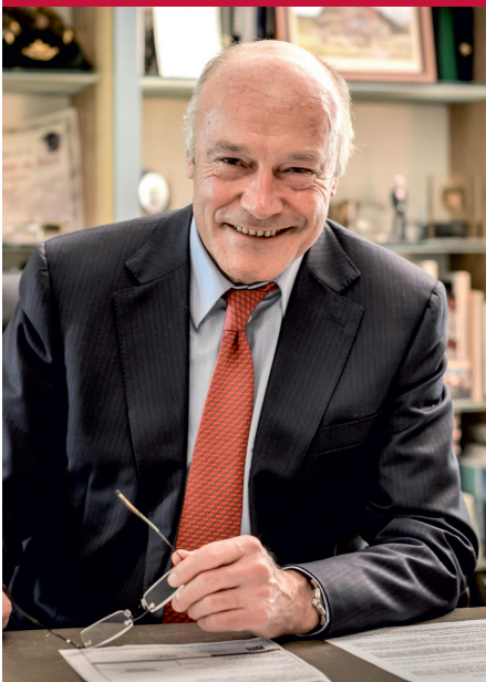
Alain Rousset Président de Région Nouvelle-Aquitaine